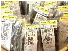
■ はねだし海苔お徳パック