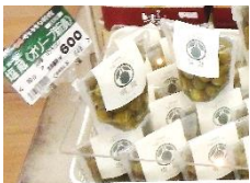
■ 手摘みオリーブ「塩蔵」