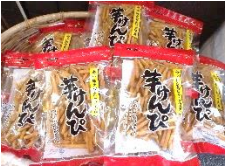
■ 芋けんぴ希少糖使用