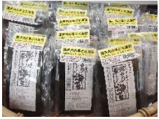
■はねだし海苔お得パック