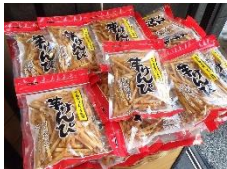
■芋けんぴ希少糖使用