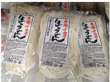
■本場さぬき生うどん